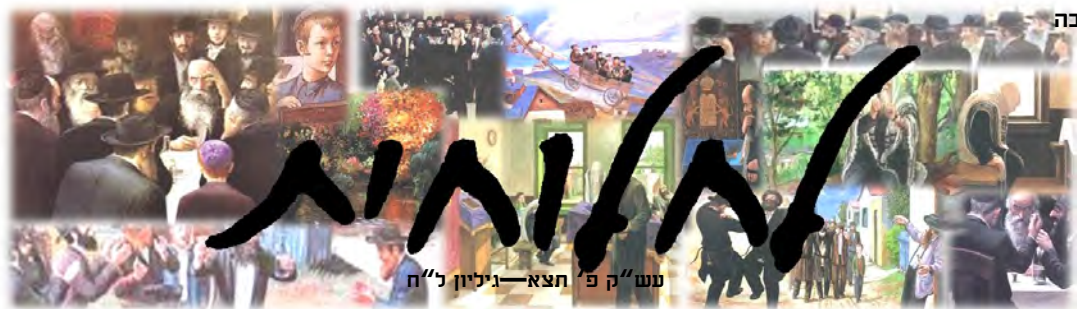
עש"ק פ' תצא - גיליון ל"ח