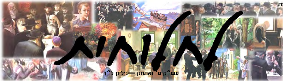
עש"ק פ' ואחחון - גיליון ל"ד