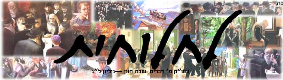
נש"ק פ' דברים, שבת חוון — גיליון ל"ג