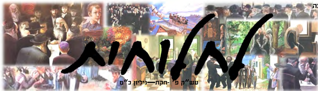
עש"ק פ' חקת - גיליון כ"ט