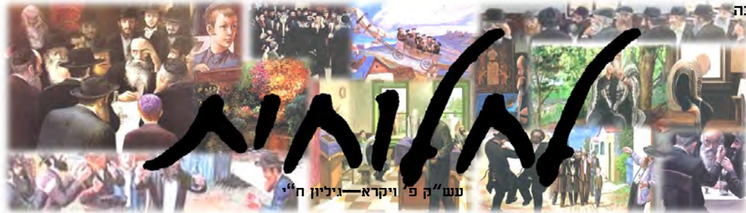
עש"ק פ' ויקרא—גיליון ח"י