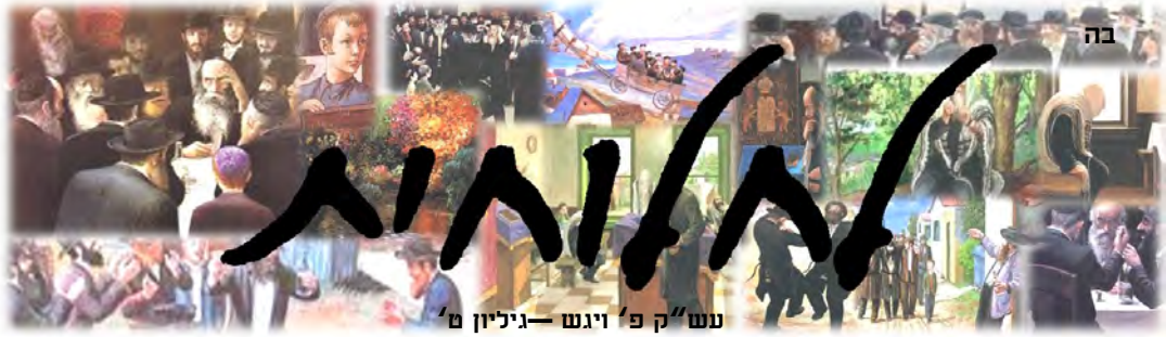
עש"ק פ' ויגש — גיליון ט'